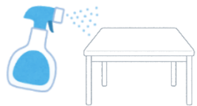
テーブルとイスの消毒 (退出時に必ず実施)