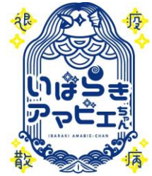
「いばらきアマビエちゃん」の登録