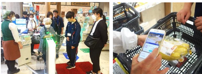
<カスミで Scan&Go 体験>

参加者からは「若い方との自然なふれあいが楽しかった。」「お付き合い感謝。」「説明してくださる方が多くてとてもわかりやすかった。こんな講座が数回あるとありがたい。」「今度買い物に行きます。」などの声が聞かれました。