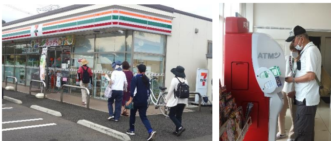
<セブンイレブンで PayPay 体験>

どちらも、行き帰りは移動距離や経路が分かる「Pacer」を使って歩きました。センターに戻った時に「Pacer」を切り忘れた方がいて「なんか声が聞こえる～(;°D°)」と慌てる珍事件もあり、みんなで笑ってしまいました。