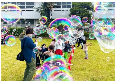
令和4・5年度 新規チャレンジ・ステップアップ助成金交付団体 肢体不自由児・医療的ケア児の家族会 そら〜ち