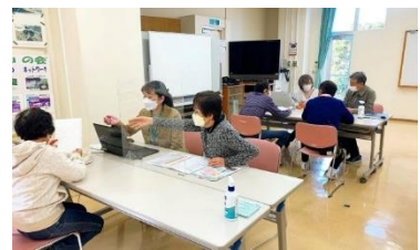
事前相談会の様子