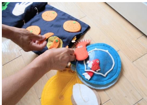
令和4・5年度 新規チャレンジ・ステップアップ助成金交付団体 守谷の図書館を考える会