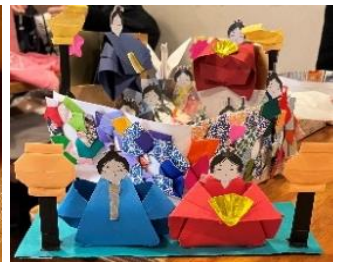
3月はお菓子付きのおひなさま